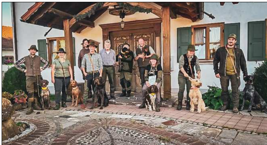
Die Teilnehmer des Hundekurses 2023

6 Hunde wurden zur QBPO angemeldet. Davon haben 5 Hunde die Prüfung bestanden. 3 Hunde durften aufgrund der Zulassungsbeschränkungen nicht teilnehmen. Diesen Hunden konnten wir aufgrund ihrer Leistung jedoch eine jagdliche Brauchbarkeit ohne Prüfung bescheinigen. Die Zulassungsbeschränkungen wurden in der neuen Prüfungsordnung im Anschluss gelockert, weswegen wir hier optimistisch sind, diese Hunde im Folgejahr auch prüfen zu können.