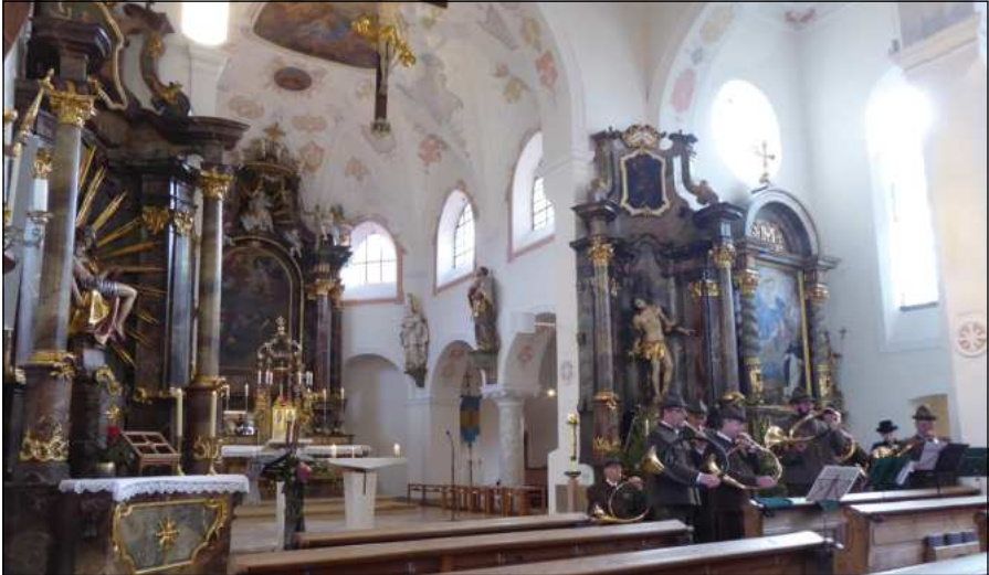
Die Jagdhornbläser bei der Arbeit und ...